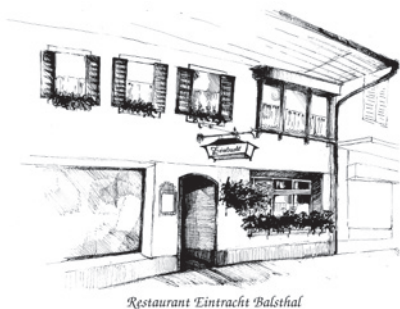
Restaurant Eintracht Balsthal