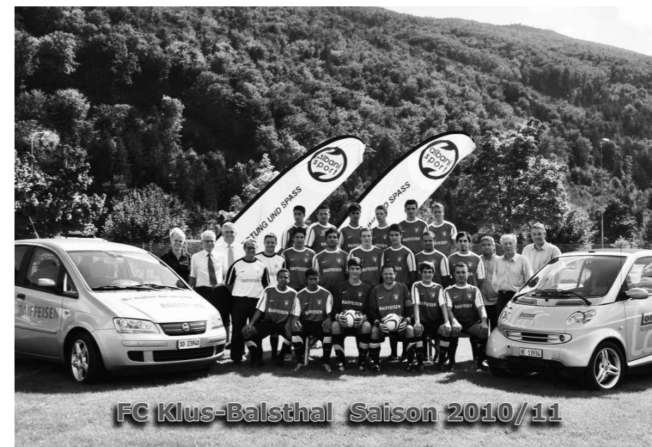
FC Klus-Balsthal Saison 2010/11

Dank der grosszügigen Unterstützung der Raiffeisenbank Balsthal-Laupersdorf und der Firma Lorenz Nutzfahrzeuge, Lyssach, spielt die 1. Mannschaft in blau/weiss gehalten. Das Auswärtsdress in weiss/schwarz.